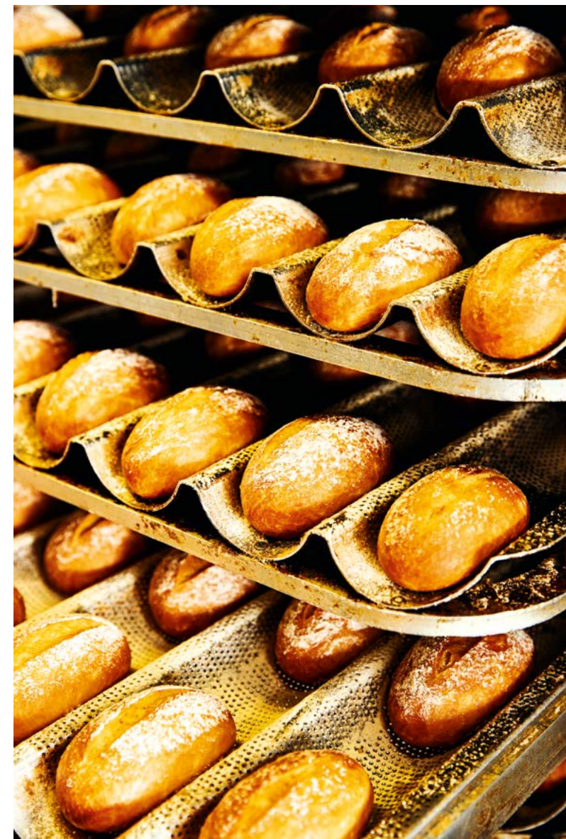
An Bord gibt es viele verschiedene Brötchen – echter Hingucker sind die schwarzen mit Sesam.